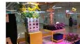
Научно-образовательный научно-просветительский проект «Экологический патруль»