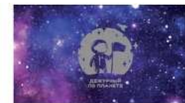
Всероссийская программа «Дежурный по планете»

Вовлечение детей и молодежи села в проектную, исследовательскую деятельность в области технологий сельского хозяйства и способствовать их ранней профессиональной ориентации в мире, развиваясь, новые профессии. С 20 февраля по 31 марта 2021 г. – регистрация участников. С 1 по 17 апреля 2021 г. – зорный региональный этап.