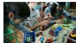
Всероссийский конкурс научно-технического творчества «ШУСТРИК»

Конкурс способствует вовлечению школьников и студентов в проектную деятельность, созданию наметов, моделей, прототипов, формирует навыки изобретательства, конструирования, моделирования и внедрения разработанных проектов. С 20 сентября 2020 г. по 20 марта 2021 г. – подача заявок на участие в конкурсе.