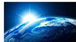
НАУЧНОЕ ОРИЕНТИРОВАНИЕ: ОТКРЫТЫЙ КОСМОС