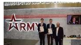
Всероссийский научно-технический конкурс ИнТЭРА

Дежурный по планете – это программа, объединяющая технологические конкурсы и проекты для школьников и студентов в области космоса.