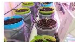
Всероссийский конкурс «АгроНТИ»

Конкурс способствует вовлечению школьников и студентов в проектную деятельность, созданию наметов, моделей, прототипов, формирует навыки изобретательства, конструирования, моделирования и внедрения разработанных проектов. С 20 сентября 2020 г. по 20 марта 2021 г. – подача заявок на участие в конкурсе.